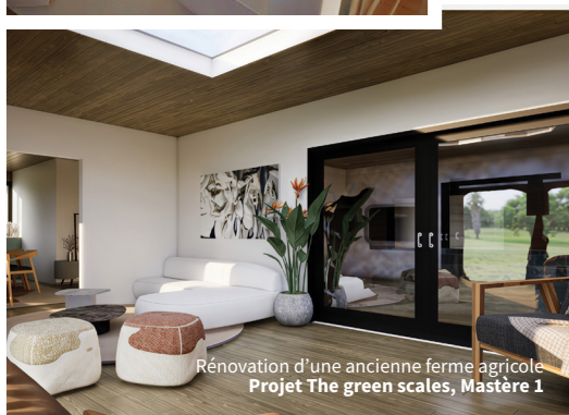
Rénovation d'une ancienne ferme agricole Projet The green scales, Mastère 1