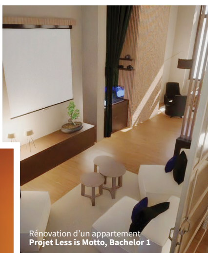
Rénovation d'un appartement Projet Less is Motto, Bachelor 1